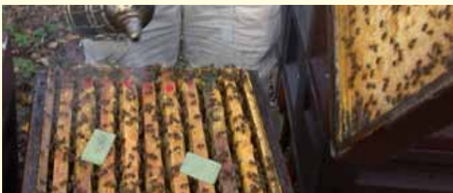
Die Behandlung mit Thymol dauert 6 Wochen. Die Dosierung erfolgt nach dem Prinzip »1+1«. Nach zwei Wochen die zweite Dosis zur ersten geben!

In Ausnahmefällen bei ungünstigen Standortbedingungen kann im Rahmen des Therapienotstandes Ameisensäure 85% in DAB-Qualität eingesetzt werden (Rezept des Tierarztes erforderlich, Bezug über Apotheken, siehe www.bienenkunde.uni-hohenheim.de ).