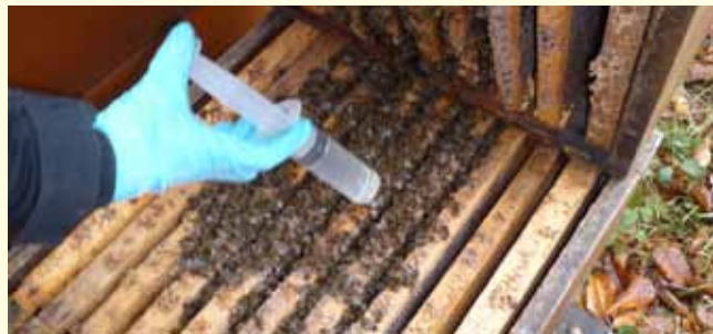
In jede besetzte Wabengasse der Wintertraube muss geträufelt werden!

Nur brutfreie Völker behandeln! Eine Anwendung genügt. Wenn Sie sich nicht sicher sind, wann der richtige Zeitpunkt ist, hören Sie unseren Ansedienst ab oder fragen Sie uns! Die Bruttemperaturfühler in den Stockwaagen des Trachtmeldedienstes bieten eine grobe Orientierung über die Brutstätigkeit der Völker in verschiedenen Regionen und Höhenlagen: www.badische-imker.de oder www.lvw.de .