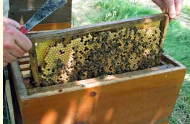
Baurahmen ans Brutnest hängen, nie an den Rand der Zarge! Bei zweizargigen Völkern in die obere Zarge. Drohnenbrut des Baurahmens niemals schlüpfen lassen!

Die Entnahme von verdeckelten Drohnenwaben im Frühjahr bremst die Befallsentwicklung bis zum Sommer. Schon wenige entfernte Milben können Schäden im Herbst verhindern.