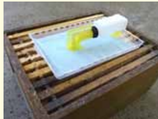
Nassenbeider Verdunster professional

Dochtgröße für den LD (links) so anpassen, dass die erwünschte Verdunstungsmenge pro Tag gewährleistet ist. Für beide gilt: Für sicheren Stand vor dem Einsetzen Wachsbrücken auf den Rähmchen entfernen. Diese Angaben gelten für Holz-Magazinbeuten im Zander-, Deutschnormal- und Langstrothmaß. Abstand zwischen Verdunstungsfläche und Brut, z.B. durch Fütterung oder Umhängen der Brutwaben, beugt Brutschäden vor.