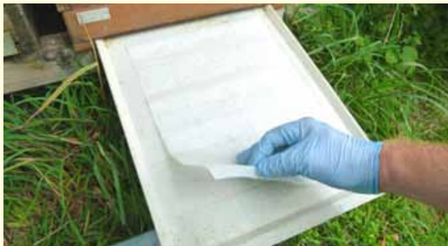
Kein Problem mit Ameisen: Eine Rolle Papierküchentücher in Plastiktüte legen und mit ca. 1 Liter Speiseöl tränken (Einmalhandschuhe verwenden).

Grundsätzlich muss im Sommer unmittelbar nach der letzten Tracht mit Ameisensäure (spätestens Ende Juli) oder Thymol (spätestens Mitte Juli) gründlich behandelt werden, um die Winterbienenbrut vor Varroabefall zu schützen. Eine „Restentmilbung“ im Spätherbst oder Winter wird generell dringend empfohlen.